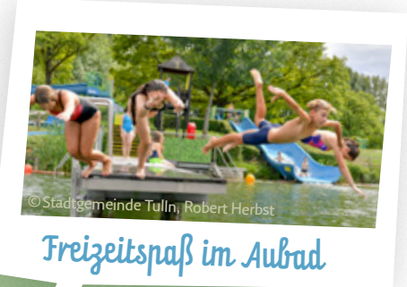
Freizeitspaß im Aubad