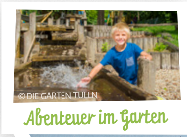
Abenteuer im Garten