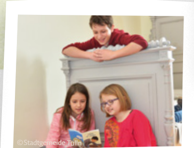
Den jungen Schiele entdecken