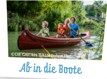
Ab in die Boote