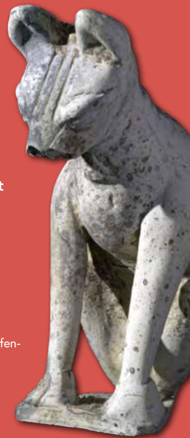
Sitzender Hund aus Pfeifenton, Kinderspielzeug (Gallien, 2. Jh. n. Chr.)

Römischer Alltag wird lebendig: So wurde gebaut und gelebt, gekämpft und geliebt, gegessen und getrunken, gefeiert und getrauert, gearbeitet und gespielt.